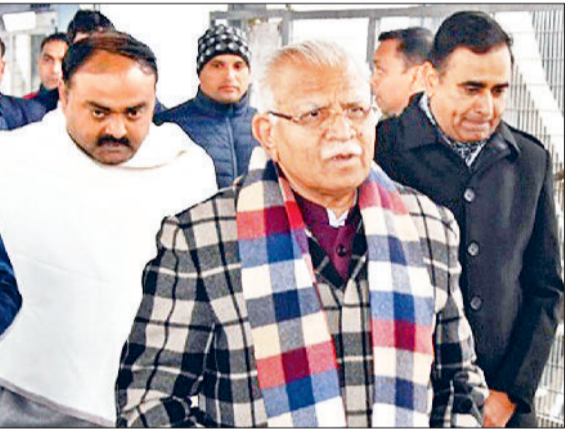
पानीपत रेलवे स्टेशन पर पहुंचे मुख्यमंत्री मनोहर लाल, साथ में भाजपा जिलाध्यक्ष दुष्यंत भट्ट।

मुख्यमंत्री मनोहरलाल मंगलवार को चंडीगढ़ से जन शताब्दी एक्सप्रेस के माध्यम से पानीपत पहुंचेंगे। पानीपत स्टेशन पर पहुंचने पर जिला प्रशासन की ओर से उपायुक्त डॉ. वीरेंद्र दहिया ने के माध्यम से मुख्यमंत्री का बुके देकर स्वागत किया। भाजपा जिला अध्यक्ष दुष्यंत भट्ट ने भी पानीपत के रेलवे स्टेशन पर मुख्यमंत्री का स्वागत किया। मुख्यमंत्री मनोहरलाल पानीपत सड़क के माध्यम से रोहतक के लिए रवाना हुए। इससे पहले मुख्यमंत्री लाल