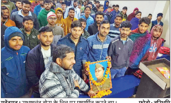
महेन्द्रगढ़। सुभाषचंद्र बोस के चित्र पर पुष्पापित करते हुए।