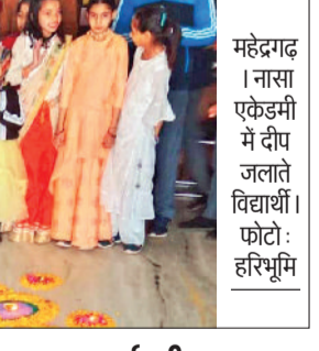
महेन्द्रगढ़। नारा एकेडमी में दीप जलाते विद्यार्थी।