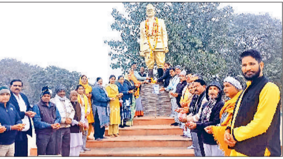
नारनौल। नेताजी सुभाषचंद्र बोस की मूर्ति पर पुष्प अर्पित करते भाजपाई।