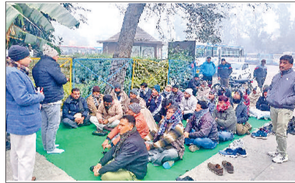
कुरुक्षेत्र। रोडवेज कर्मियों को संबोधित करते यूनियन नेता।

मानी गई मांगों का परिपत्र जारी नहीं करने पर आंदोलन की चेतावनी