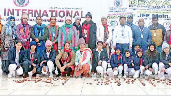
महेन्द्रगढ़। देवयानी स्कूल में दीप जलाते विद्यार्थी।