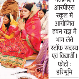
महेन्द्रगढ़। आरपीएस स्कूल में आयोजित हवन यज्ञ में भाग लेते स्टाफ सदस्य एवं विद्यार्थी।

अयोध्या में बने भव्य मंदिर में रामलला विराजमान होने के अवसर पर आरपीएस विद्यालय में भी राम उत्सव हर्षोल्लास उमंग के साथ मनाया गया। विद्यालय प्रांगण में रामलला की प्राण प्रतिष्ठा के दौरान 2 लाख 51 हजार दीप जलाकर दीपोत्सव मनाया गया। भगवान श्रीराम की भव्य झांकी निकली गई तथा 108 कुंडीय हवन का आयोजन किया गया। विद्यार्थियों के विद्यार्थियों द्वारा भगवान राम के आदर्शों पर आधारित सुंदर व भव्य सांस्कृतिक कार्यक्रमों की प्रस्तुतियों ने मनमोह