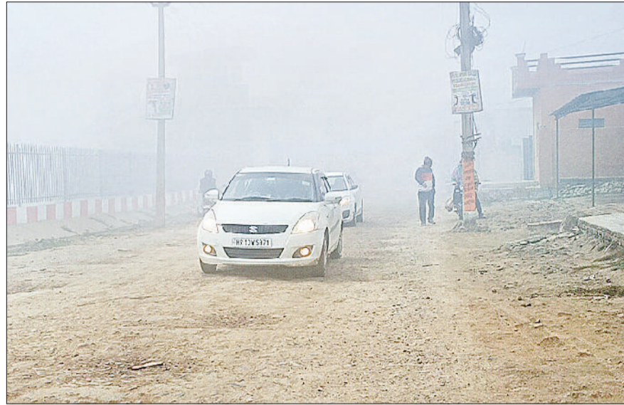
यमुनानगर। मंगलवार को घने कोहरे में सड़कों पर लाइटें जलाकर गंतव्य पर पहुंचते वाहन।

मंगलवार को तड़के तीन बजे से ही जिले में शीतलहर और घना कोहरा का प्रकोप बढ़ने लगा था। आलम यह था कि सड़कों पर सुबह दस बजे तक घना कोहरा छाया रहा। जिसमें लोगों को चार फुट की दूरी पर भी वाहन व अन्य कोई वस्तु दिखाई नहीं दी। वाहन चालक लाइटें जलाकर सड़कों से गुजरने पर मजबूर थे। सुबह करीब ग्यारह बजे के बाद घना कोहरा तो कम हो गया। मगर दिन भर आसमान में धुंध के बादल छाए रहे और