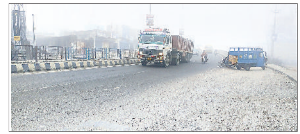
कुरुक्षेत्र। सुबह आसमान में छाई धुंध व अपने गंतव्य की ओर जाते वाहन चालक।

जिला में मंगलवार को भी ठंड का सितम जारी रहा। शीतलहर के कारण हर कोई ठंड से बचने के उपाय ढूंढता दिखाई दिया। ठंड से बचने के लिए ज्यादातर दुकानदारों ने अलावा जलाया। शीतलहर बेजुबान पशुओं पर भी भारी पड़ रही है। सड़कों बेजुबान पशुओं पर धूम रहे पर भी भारी गोवंश के लिए पड़ रही यह ठंड खतरा साबित हो सकती है। धूप न निकलने से सर्दी बढ़ गई है। कड़के की ठंड से हर कोई परेशान है। दिन के समय शीतलहर चलने के कारण ठंड अधिक हो रही है। मंगलवार को सुबह के समय हल्की धुंध थी। बाद में कोहरा छंट गया। बादल छाने के कारण दिनभर धूप नहीं निकली। सुबह से लेकर शाम तक ठंडी हवा चलने के कारण अधिकतर लोग अपने घरों के अंदर ही दुबके रहे। ठंड के चलते जन जीवन प्रभावित