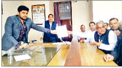
महेन्द्रगढ़। एसडीएम को ज्ञापन सौंपते हुए।

जानकारी के मुताबिक सतनाली ब्लॉक का गांव ढाणी कुम्हारान से नारनौल की दूरी लगभग 65 किलोमीटर है तथा कनीना ब्लॉक के गांव स्याणा, नौताना आदि की दूरी भी करीब 60 किलोमीटर है। दिसंबर 2019 में जिन युवाओं ने कंडेक्टर लाइसेंस बनवाने व फस्ट एंड करने पर भी आज तक उनको फस्ट एंड का सर्टिफिकेट बार-बार रेडकांस व