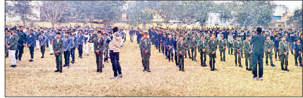
नारनौल। पीटी शो में भाग लेते स्कूली बच्चे।