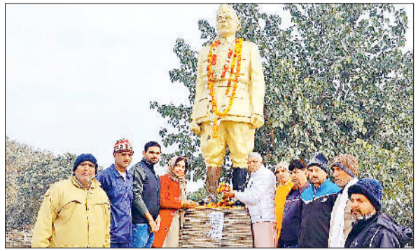
नारनौल। नेताजी सुभाषचंद्र बोस की मूर्ति पर पुष्प अर्पित करते हुए।